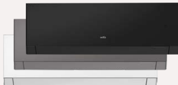
Wilfa Nordkapp 30: Matt hvit Wilfa Nordkapp 40: Matt hvit, mørk grå og sort